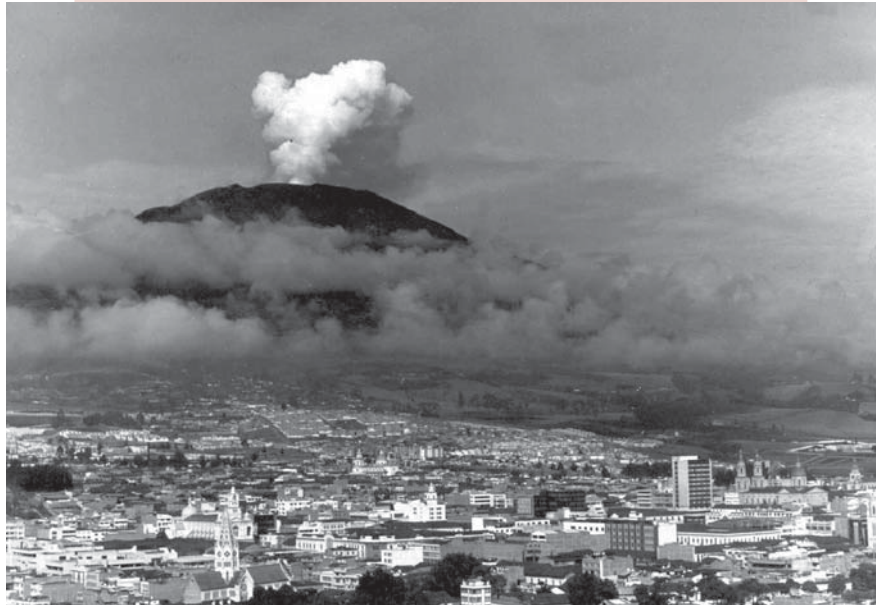
Erupción del volcán galeras

Actualmente, nuestra sociedad considera las epidemias como