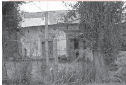
Casa deteriorada, Isla de Maipo, Chile.

El peso de la pobreza recae con mayor fuerza sobre ciertos grupos. Por ejemplo, la población indígena representa una parte significativa de la población rural pobre y de la creciente población urbana pobre.